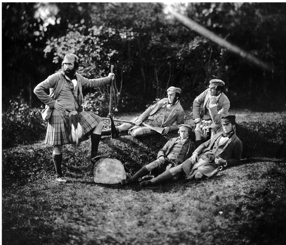
Roger Fenton, az első angol udvari fényképész szignált képe: Skót vadászinasok Balmoralban, 1856.