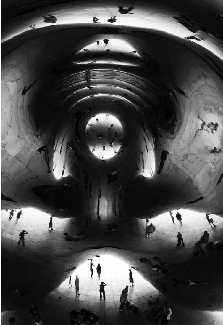
The Cloud Gate (A Felhókapu) II. - Chicago, USA