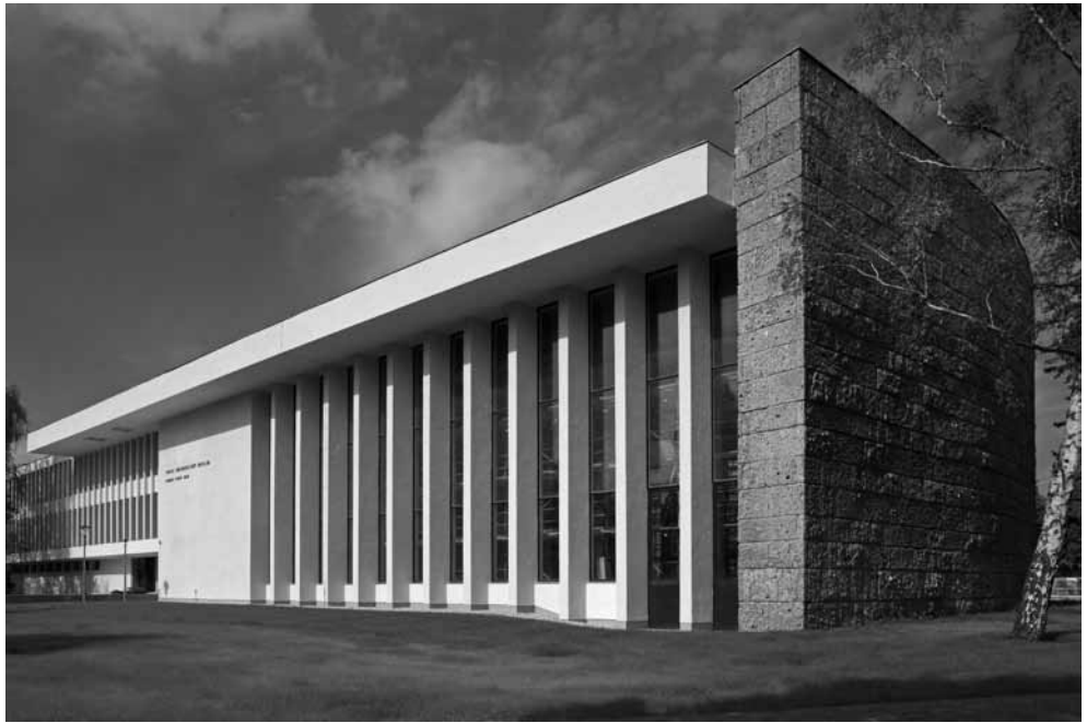
Henry Ford Épület (Freien Universität, Berlin)