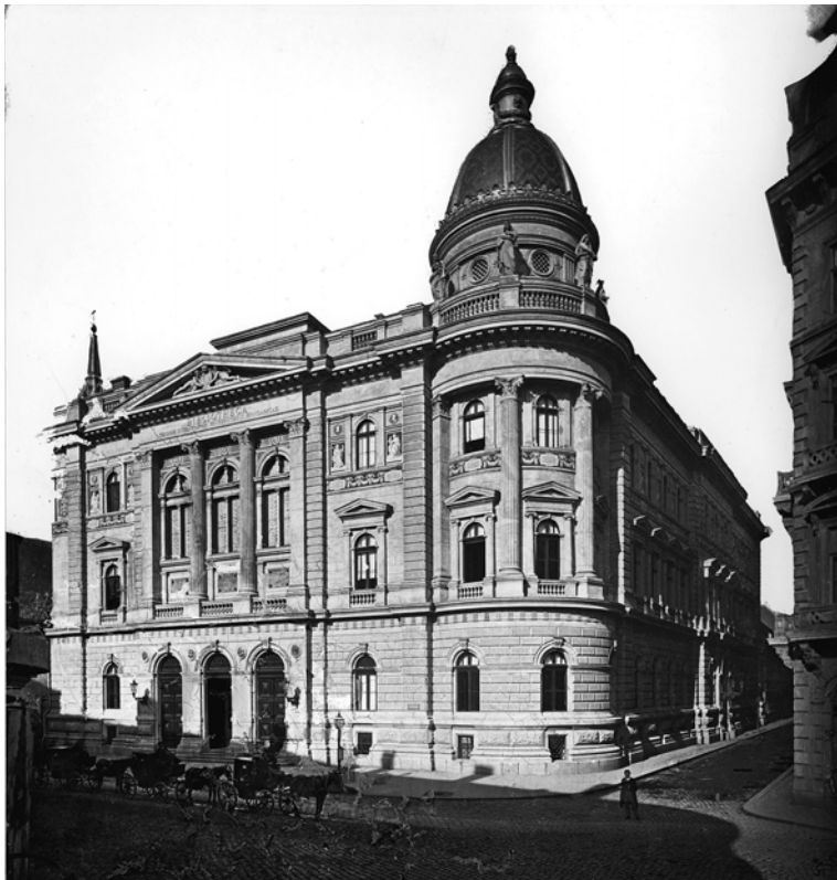
Az Egyetemi Könyvtár épülete, 1875 körül