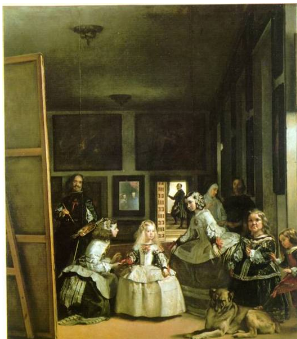
Diego Velázquez: Las Meninas